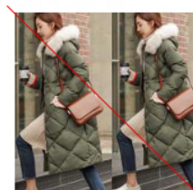
동일이미지 반복 (X)