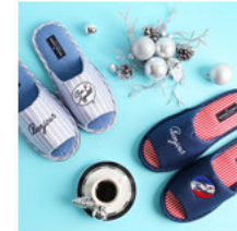
다른컬러 상품코드 (O)