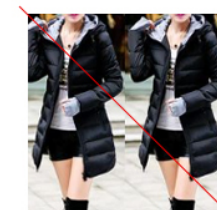
동일이미지 반복 (X)