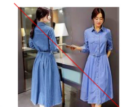
동일이미지 앞뒤 (X)