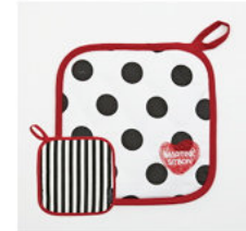
세트 상품 (O)