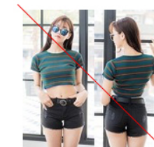
동일이미지 앞뒤 (X)