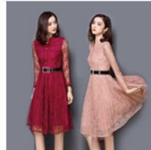
다른컬러 상품코드 (O)